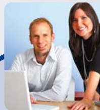
LE FOURNISSEUR OU SOUS-TRAITANT